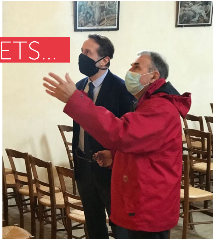
Le 22 janvier dernier, nous avons accueilli à Genouillé, Benoît Byrski, nouvellement nommé Sous-préfet de Montmorillon, pour lui présenter la commune et les actions que nous souhaitons développer. Un moment important et fort qui a permis de recueillir une véritable adhésion du représentant de l'Etat et d'obtenir un engagement à soutenir financièrement les actions communales, notamment la revitalisation du centre-bourg. Un homme disponible et à l'écoute, très attaché à être au plus près des élus locaux.

Très prochainement, des travaux débiteront pour réparer l'éclairage public du centre-bourg. Par ailleurs, des démarches sont menées avec Eaux de Vienne, en charge de l'assainissement, pour desservir le village de La Garde et remettre à niveau les installations de La Touche et de La Trafigère, qui dysfonctionnent depuis trop longtemps.